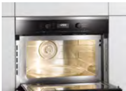
Рабочая камера объёмом 46 л

Miele предлагает микроволновые печи с рабочей камерой объёмом 46 л. Микроволновые печи Miele – идеальное решение как для основных блюд, так и для закусок!