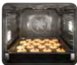
Шафы большой вместимости: 76 л

Вы любите готовить большие куски мяса или печь печенье в больших количествах? Каковы бы ни были Ваши предпочтения, Miele предоставит Вам достаточно места!