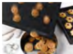
Только у Miele PerfectClean

Miele предлагает два варианта решения проблемы, которые значительно упрощают процесс, – покрытие PerfectClean и систему пиролизической очистки.