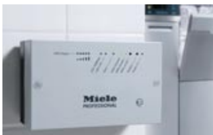
Модуль удаленного доступа

Дезинфекторы серии PG 85 вводят новые стандарты для будущего автоматической обработки медицинского инструмента в клиниках, врачебной практике и операционных центрах. Приобретая дезинфекторы Miele Professional, пользователь получает комплексное решение – надежную систему мойки и дезинфекции и фирменный сервис Miele. По мнению клиентов, компания Miele уже в течение многих лет предоставляет отличное сервисное обслуживание благодаря своей квалифицированной сервисной службе. Разветвленная сервисная сеть позволяет предоставить оперативную помощь клиенту. Кроме того, Miele предлагает оптимальное решение для клиник и операционных центров – удаленный сервис (Remote Service), возможность диагностики неполадок посредством телекоммуникационного соединения. Это решение гарантирует пользователю компетентное сервисное обслуживание и быстрое решение проблем с минимальными потерями времени и тем самым, отличную безопасность, оптимальную надежность и максимальную экономичность.